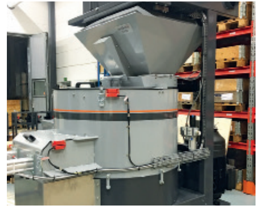
Die Chargengröße kann dank der eingebauten Waage entsprechend angepasst werden.