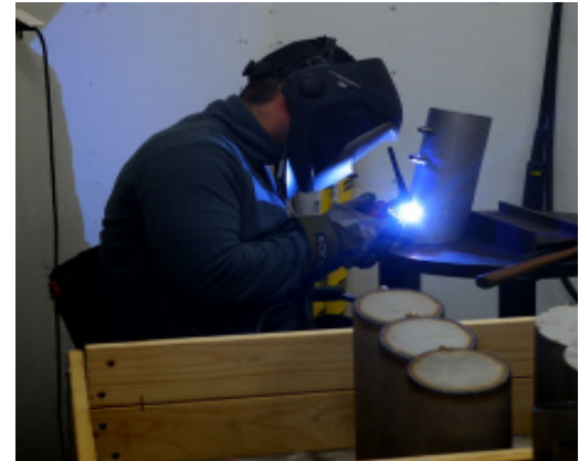
Die NoroGard-Maschinen sind auf eine Standzeit von 20 Jahren ausgelegt.