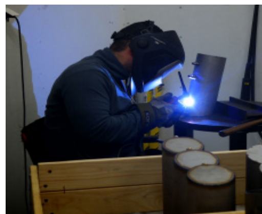
Les machines NoroGard sont conçues pour durer 20 ans.